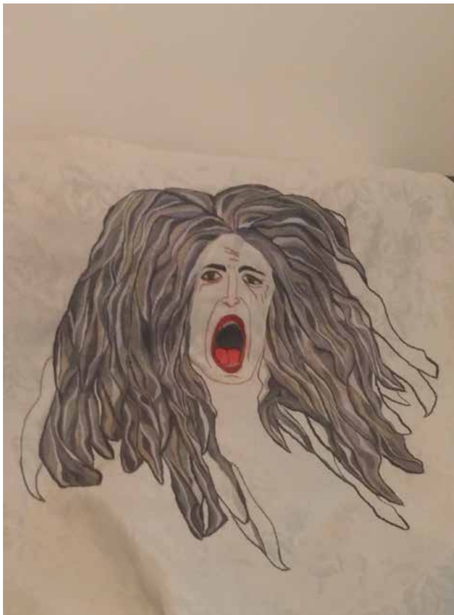
חנה שיר מדוזה כועסת, רקמה על מפה ישנה, 100x94 ס"מ