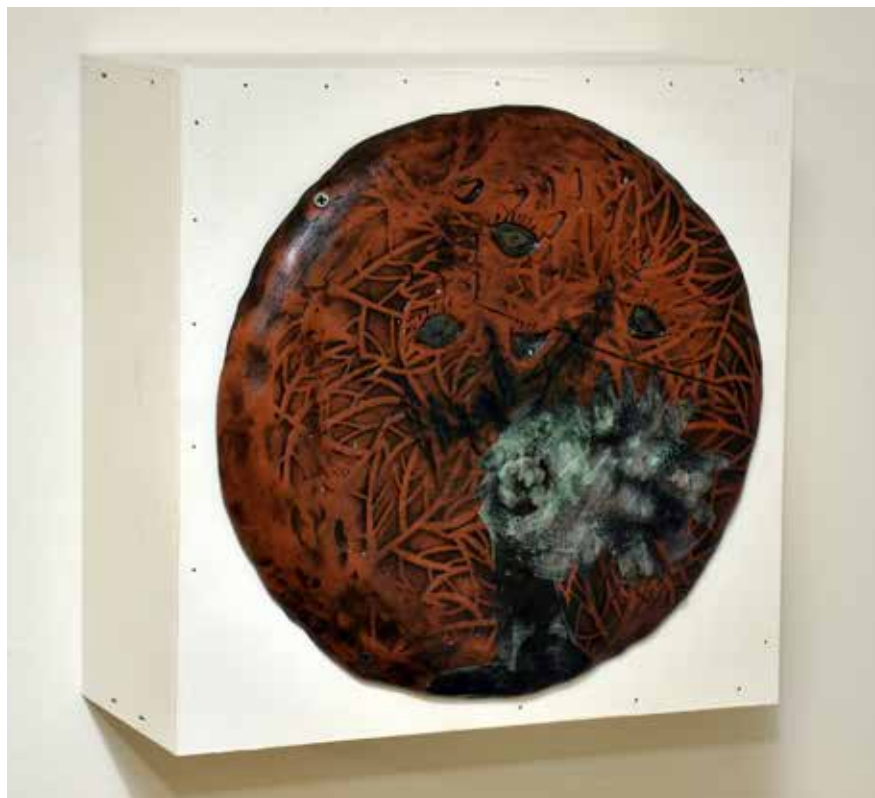
חדוה ראובן מסדרת "צ'רלי צ'פלין", טכניקה מעורבת על חומר, קוטר 34 ס"מ