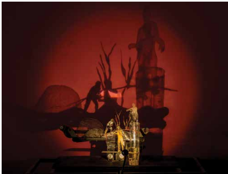
נעה רז מלמד אודיסאה, פסל קינטי, טכניקה מעורבת