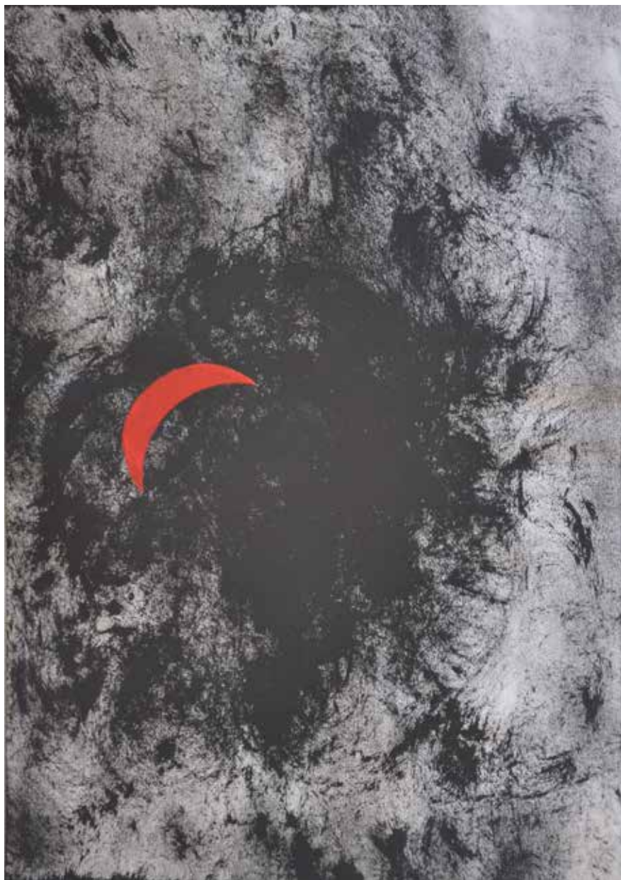
דן בירנבוים 'הירח', אקריליק על נייר, 40x30 ס"מ