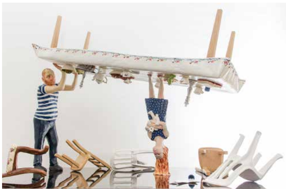
ורד אהרונוביץ' מסיבת התה, פסל, טכניקה מעורבת