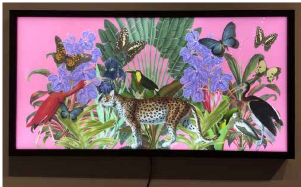
דינה גולדשטיין המעין, קולאז' דיגיטלי, ממוסגר כקופסת אור, 33X63 ס"מ