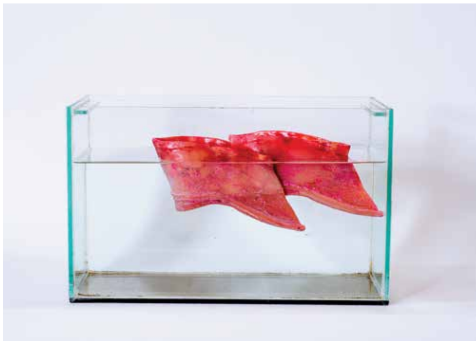
דבורה מורג אקוריום, יציקת נעלי אישה סינית, פוליאסטר, 17X31 ס"מ