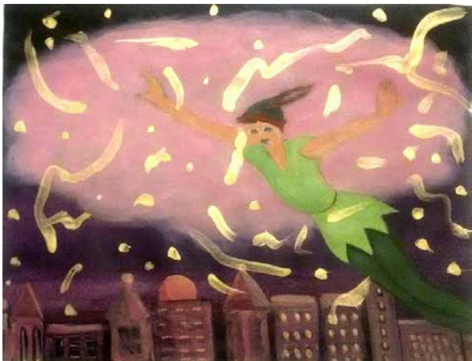
מירה צדר פיטר פן, 2016, אקריליק על נייר 21X28 ס"מ