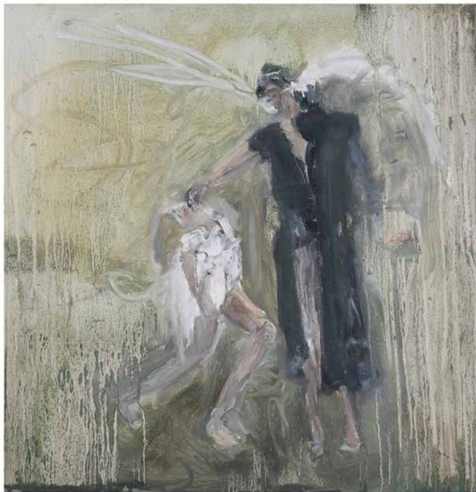
איילת ריזה דמות שחורה, שמן על קנווס, 50x50 ס"מ