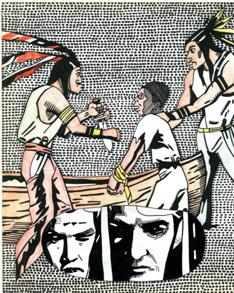
גרי גולדשטיין מתוך Jack Le Petit, דיו, עט לבד על בסיס שמן, עפרון צבעוני וטיפקס על דף של ספר, 14.8x21 ס"מ