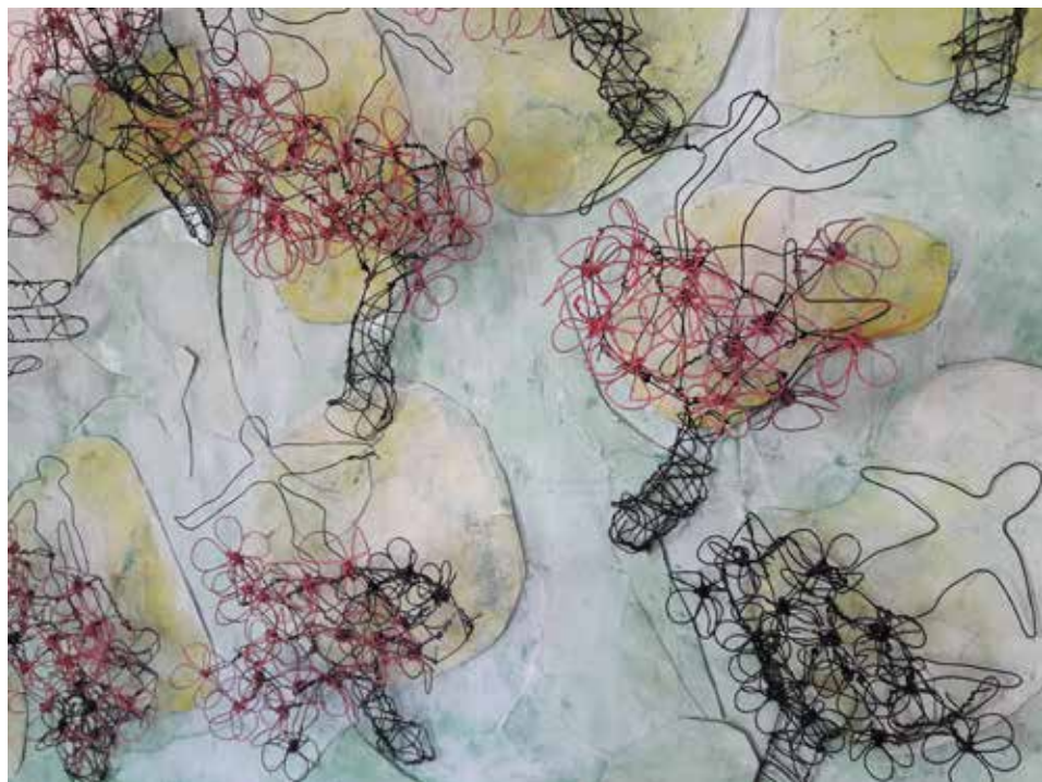
דיייד אייזקס פרט מתוך הענק וגנו (אוסקר ווילד), 2016, חוט ברזל ונייר, 50X160 ס"מ