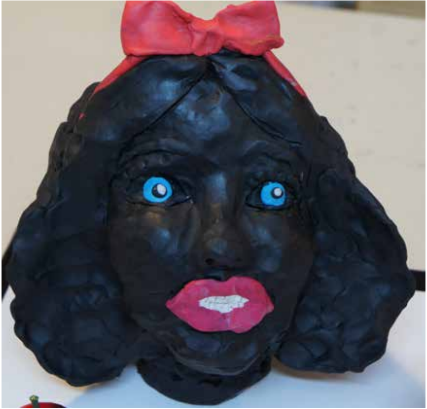
דורה דקל דיוקן שלגיה שחורה, פלסטלינה, 25X25X10 ס"מ