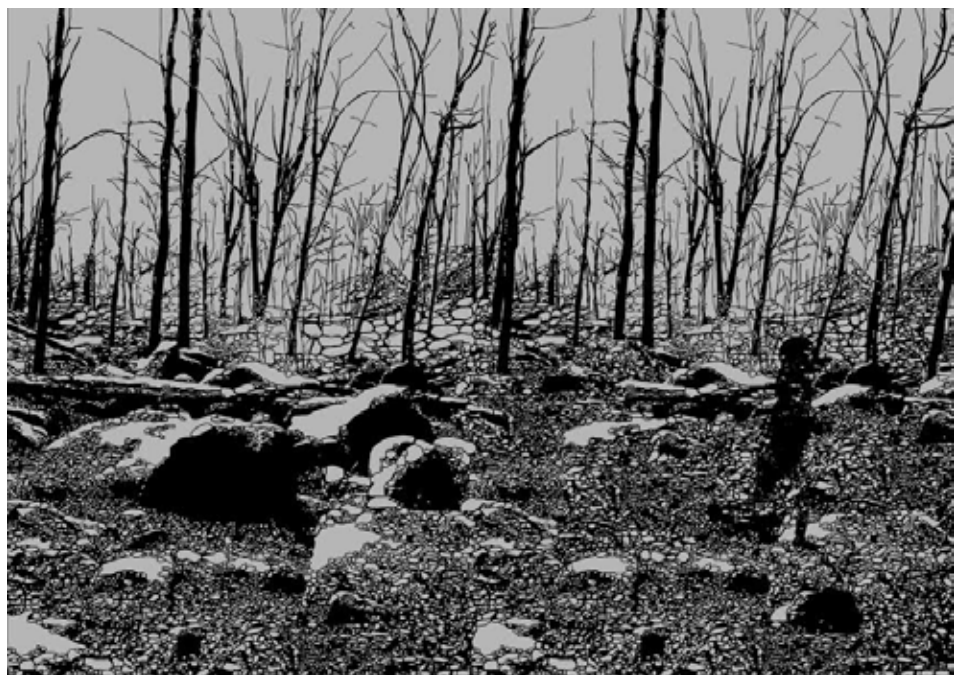
מורן קליגר עקבות זיכרון, הדפס משי על נייר, 40x48 ס"מ