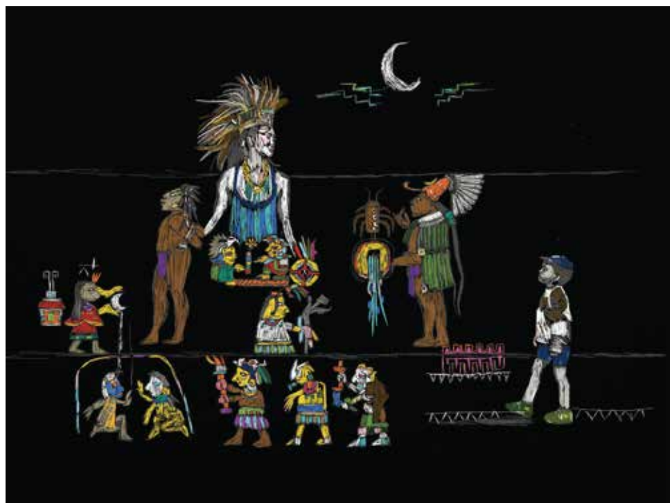
שחר סריג 'חלום ילדות על גבעה ומכונית', פרט ממיצב, הדפס על לוחות אלומיניום