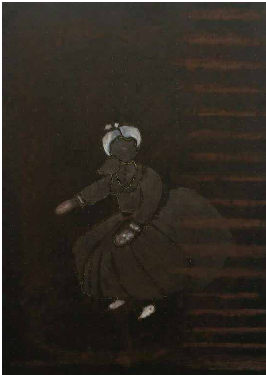
צילה פרידמן סינדרלה, אקריליק ורישום צהוב דמוי רקמה על נייר שחור, 30X21 ס"מ