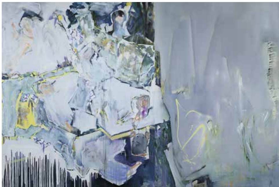
אורית טוכמן דואר פיית השיניים, שמן על בד, 180x270 ס"מ