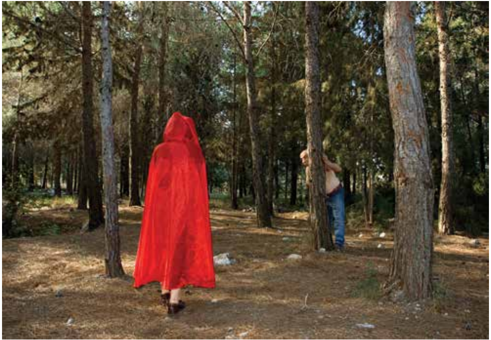
ורד ניסים ללא כותרת, צילום, 50x70 ס"מ